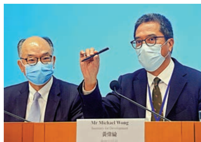
▲發展局局長黃偉綸（右）希望立法會支持通過「明日大嶼」計劃的前期研究撥款 大公報記者馬丁攝