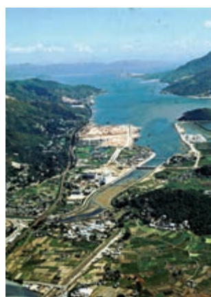
▲當年發展沙田新市鎮時，曾填海逾六百多萬呎

何為「第一城模式」呢？原來政府於70年代中期發展沙田新市鎮時，曾讓發展商公開競投沙田海床逾六百多萬呎的填海工程，結果由恒基地產、長江實業、新鴻基地產和新世界發展合組的聯營公司，以2060萬元投得。工程完成後，發展商須將三分二地皮交還政府作公共房屋及基建發展之用，其餘部分則發展為現時的沙田第一城。發展商須承擔填海費用外，亦須繳付每年2000元作地租；當局亦就規劃定下多項條款約束，包括規定於三年內完成填海工程、須負責在區內興建兩所小學及一所中學。